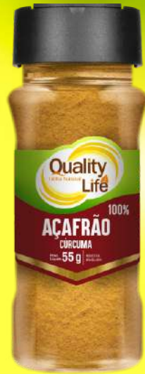
CÓD: 6329 - AÇAFRÃO 55g CX: 6X55g - EAN: 7 896547 903095