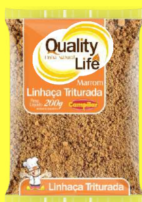
CÓD: 062 - SEMENTE LINHAÇA TRIT. MARROM - 200g - CX: 12X200g EAN: 7 896547 905532