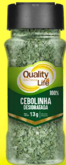
CÓD: 6334 - CEBOLINHA DESID. 13g CX: 6X13g - EAN: 7 896547 903200