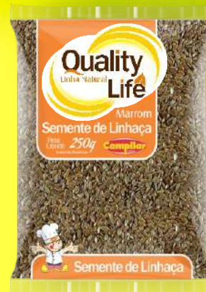
CÓD: 059 - SEMENTE DE LINHAÇA MARROM - 250g - CX: 12X250g EAN: 7 896547 905525