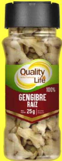
CÓD: 6346 - GENGIBRE RAÍZ 25g CX: 6X25g - EAN: 7 896547 903354