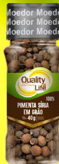
CÓD: 6355 - PIMENTA SÍRIA 40g CX: 6X40g - EAN: 7 896547 903743