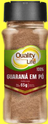
CÓD: 6347 - GUARANÁ EM PÓ 65g CX: 6X65g - EAN: 7 896547 903361