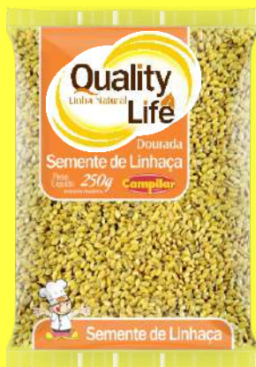
CÓD: 060 - SEMENTE LINHAÇA DOURADA - 250g - CX: 12X250g EAN: 7 896547 905617