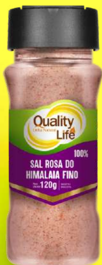
CÓD: 6478 - SAL DO HIMALAIA 120g CX: 6X120g - EAN: 7 896547 903750