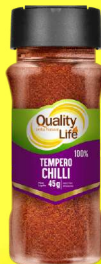
CÓD: 6461 - TEMPERO CHILLI 45g CX: 6X45g - EAN: 7 896547 903699