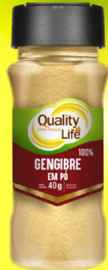
CÓD: 6345 - GENGIBRE PÓ 40g CX: 6X40g - EAN: 7 896547 903347