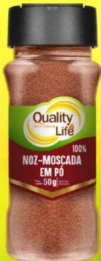
CÓD: 6353 - NOZ-MOSCADA EM PÓ 50g CX: 6X50g - EAN: 7 896547 903460