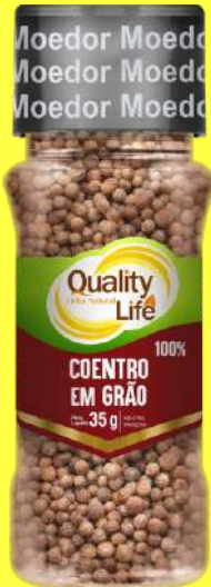
CÓD: 6336 - COENTRO EM GRÃO 35g CX: 6X35g - EAN: 7 896547 903231