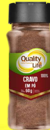
CÓD: 6339 - CRAVO EM PÓ 60g CX: 6X60g - EAN: 7 896547 903286