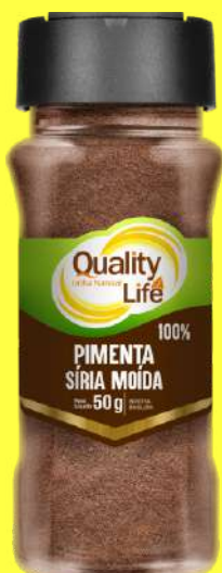
CÓD: 6455 - PIMENTA SÍRIA MOÍDA 50g CX: 6X50g - EAN: 7 896547 903576