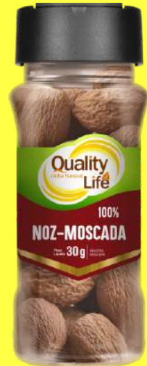
CÓD: 6352 - NOZ-MOSCADA 30g CX: 6X30g - EAN: 7 896547 903453