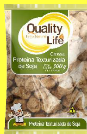
CÓD: 1803 - PROTEÍNA DE SOJA GROSSA 300g - FD: 6X300g EAN: 7 896547 900414