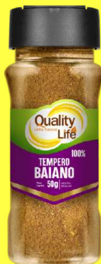
CÓD: 6460 - TEMPERO BAIANO 50g CX: 6X50g - EAN: 7 896547 903682