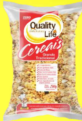
CÓD: 071 - GRANOLA TRADICIONAL 230g - CX: 10X230g EAN: 7 896547 905822