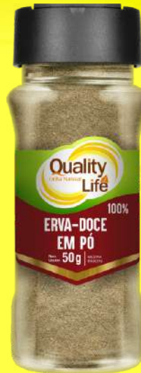
CÓD: 6342 - ERVA-DOCE EM PÓ 50g CX: 6X50g - EAN: 7 896547 903323