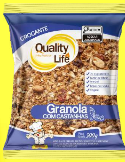
CÓD: 6810 - GRANOLA C/ CASTANHAS CROCANTE - 500g CX: 10X500g - EAN: 7 896547 904405