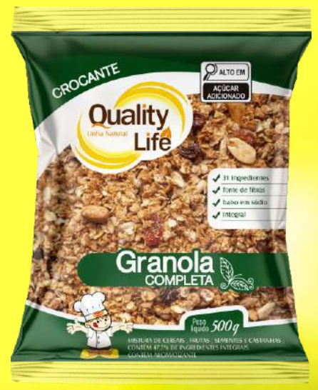
CÓD: 6809 - GRANOLA COMPLETA CROCANTE - 500g CX: 10X500g - EAN: 7 896547 904412