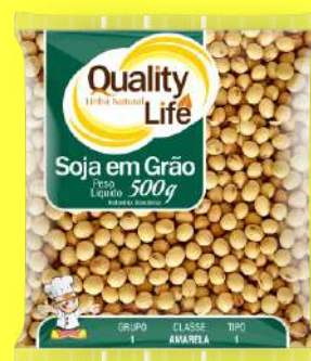
CÓD: 147 - SOJA EM GRÃO 500g - FD: 12X500g EAN: 7 896547 908342