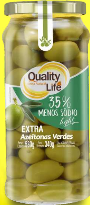
CÓD: 5923 - AZEITONA 35% MENOS SÓDIO COM CAROÇO EXTRA - 340g - CX: 6X340g EAN: 7 896547 902241