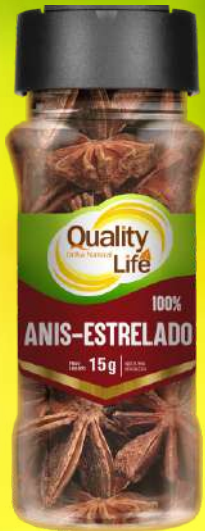
CÓD: 6331 - ANIS-ESTRELADO 15g CX: 6X15g - EAN: 7 896547 903156