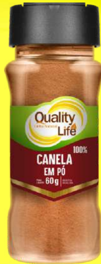
CÓD: 6332 - CANELA EM PÓ 60g CX: 6X60g - EAN: 7 896547 903194