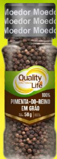
CÓD: 6451 - PIMENTA-DO-REINO EM GRÃO 58g - CX: 6X58g EAN: 7 896547 903606