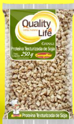
CÓD: 058 - PROTEÍNA DE SOJA 250g - FD: 12X250g EAN: 7 896547 909226