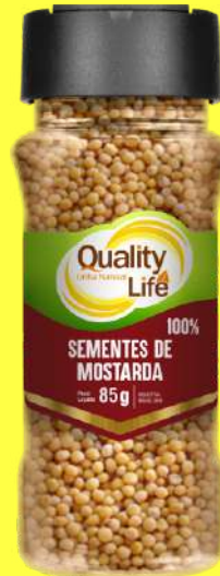
CÓD: 6351 - SEMENTE DE MOSTARDA 85g CX: 6X85g - EAN: 7 896547 903651