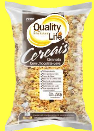
CÓD: 070 - GRANOLA COM CHOCOLATE - 230g - CX: 10X230g EAN: 7 896547 905860