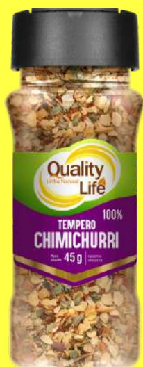
CÓD: 6462 - TEMPERO CHIMICHURRI 45g CX: 6X45g - EAN: 7 896547 903217