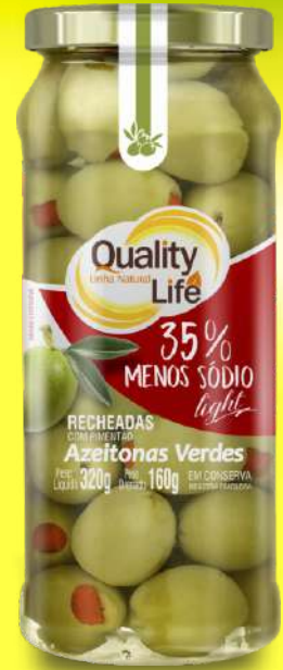
CÓD: 5921 - AZEITONA VERDE RECHEADA COM PIMENTÃO - 160g - CX: 6X150g EAN: 7 896547 902296