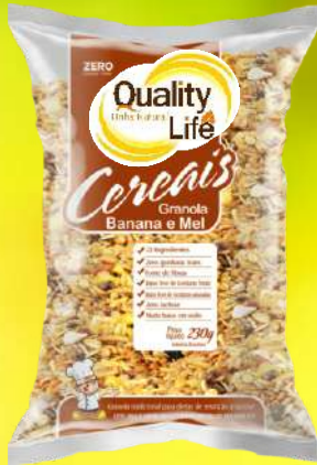
CÓD: 069 - GRANOLA BANANA E MEL - 230g CX: 10X230g EAN: 7 896547 905846