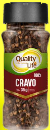
CÓD: 6340 - CRAVO 35g CX: 6X35g - EAN: 7 896547 903293