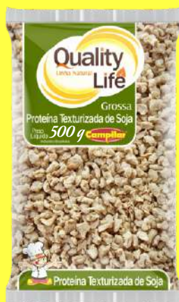
CÓD: 054 - PROTEÍNA DE SOJA 500g - FD: 6X500g EAN: 7 896547 909233