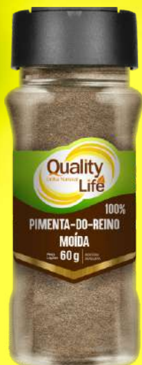
CÓD: 6453 - PIMENTA-DO-REINO MOÍDA 60g CX: 6X60g - EAN: 7 896547 903613