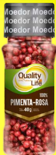
CÓD: 6354 - PIMENTA ROSA 40g CX: 6X40g - EAN: 7 896547 903569