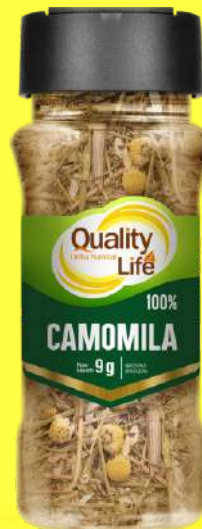
CÓD: 6454 - CAMOMILA 9g CX: 6X09g - EAN: 7 896547 903170