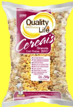
CÓD: 068 - GRANOLA COM FRUTAS - 230g - CX: 10X230g EAN: 7 896547 905839