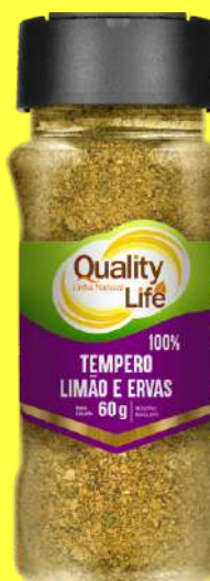
CÓD: 6463 - TEMPERO LIMÃO E ERVAS 60g - CX: 6X60g EAN: 7 896547 903705