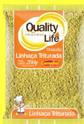
CÓD: 1221 - SEMENTE LINHAÇA TRIT. DOURADA - 200g - CX: 12X200g EAN: 7 896547 907765