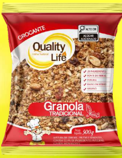
CÓD: 6808 - GRANOLA TRAD. CROCANTE - 500g CX: 10X500g - EAN: 7 896547 905839