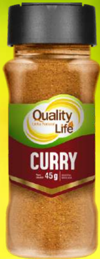
CÓD: 6341 - CURRY 45g CX: 6X45g - EAN: 7 896547 903309