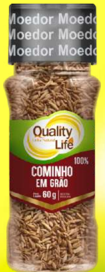
CÓD: 6337 - COMINHO EM GRÃO 60g CX: 6X60g - EAN: 7 896547 903262