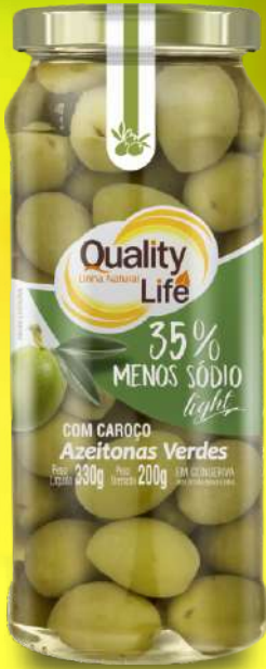
CÓD: 5922 - AZEITONA 35% MENOS SÓDIO COM CAROÇO - 200g - CX: 6X200g EAN: 7 896547 902289