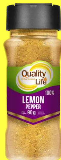
CÓD: 6434 - LEMON E PEPPER 90g CX: 6X90g - EAN: 7 896547 903392