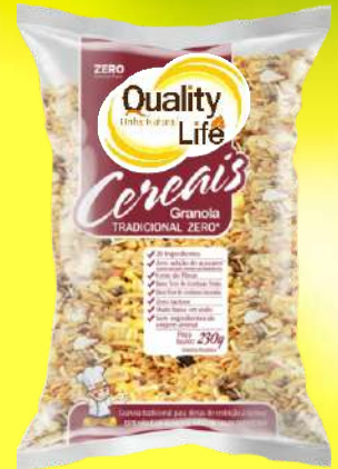
CÓD: 072 - GRANOLA TRAD. ZERO - 230g - CX: 10X230g EAN: 7 896547 905907