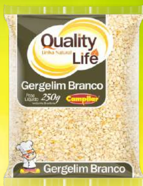
CÓD: 045 - GERGELIM BRANCO 250g - FD: 6X250g EAN: 7 896547 905754