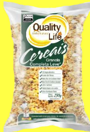
CÓD: 065 - GRANOLA COMPLETA 230g - CX: 10X230g EAN: 7 896547 905853