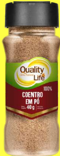
CÓD: 6335 - COENTRO EM PÓ 40g CX: 6X40g - EAN: 7 896547 903248