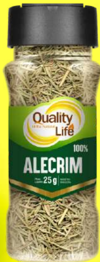
CÓD: 6330 - ALECRIM 25g CX: 6X25g - EAN: 7 896547 903101