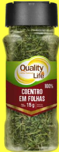
CÓD: 6338 - COENTRO EM FOLHAS 15g CX: 6X15g - EAN: 7 896547 903224