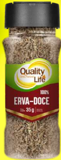
CÓD: 6343 - ERVA-DOCE 35g CX: 6X35g - EAN: 7 896547 903316