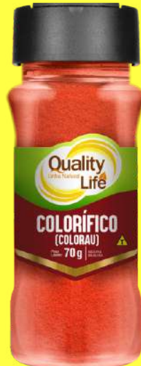
CÓD: 6465 - COLORÍFICO 70g CX: 6X70g - EAN: 7 896547 903255