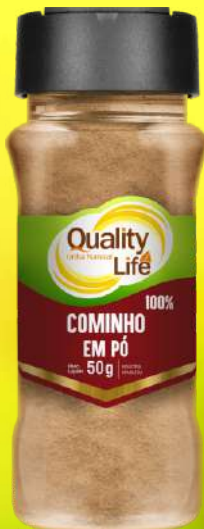
CÓD: 6433 - COMINHO MOÍDO 50g CX: 6X50g - EAN: 7 896547 903279