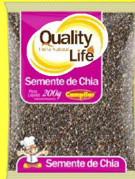
CÓD: 1676 - SEMENTE DE CHIA 200g - FD: 6X200g EAN: 7 896547 900476