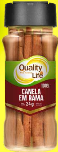
CÓD: 6333 - CANELA EM RAMA 24g CX: 6X24g - EAN: 7 896547 903187