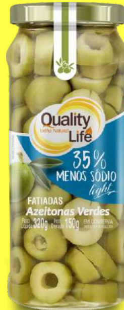
CÓD: 5919 - AZEITONAS VERDES FATIADAS - 150g - CX: 6X150g EAN: 7 896547 902302