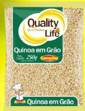
CÓD: 047 - QUINOA EM GRÃO 250g - FD: 6X250g EAN: 7 896547 905723