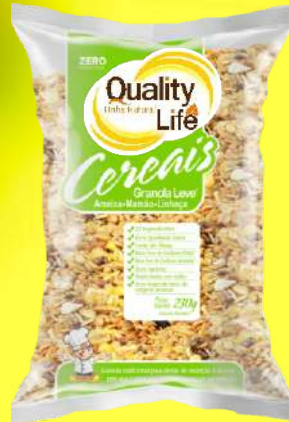
CÓD: 066 - GRANOLA AMEIXA MAMÃO E LINHAÇA - 230g CX: 10X230g - EAN: 7 896547 905884