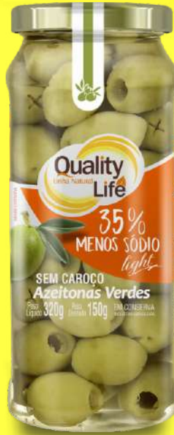
CÓD: 5920 - AZEITONA 35% MENOS SÓDIO SEM CAROÇO - 150g - CX: 6X150g EAN: 7 896547 902319