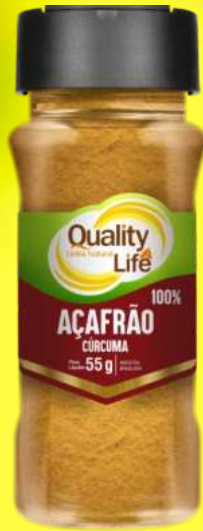
CÓD: 6329 - AÇAFRÃO 55g CX: 6X55g - EAN: 7 896547 903095