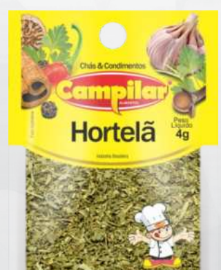
CÓD: 1355 - HORTELÃ - 4g CX: 30X4g - EAN: 7 896547 900278