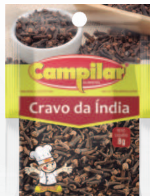
CÓD: 099 - CRAVO DA ÍNDIA - 8g CX: 30X8g - EAN: 7 896547 900094