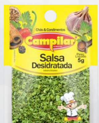
CÓD: 1358 - SALSA DESIDRATADA - 5g CX: 30X5g - EAN: 7 896547 900315