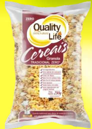
CÓD: 072 - GRANOLA TRAD. ZERO - 230g - CX: 10X230g EAN: 7 896547 905907