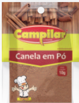
CÓD: 076 - CANELA EM PÓ - 10g CX: 30X10g - EAN: 7 896547 900117