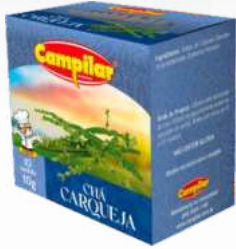
CÓD: 5539 - CHÁ CARQUEJA 10g CX: 12X10g - EAN: 7 898007 901343