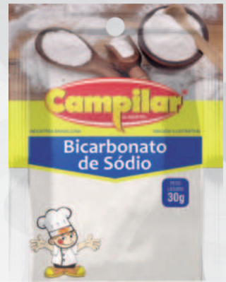
CÓD: 086 - BICARBONATO DE SÓDIO - 30g CX: 30X30g - EAN: 7 896547 900018