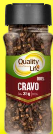
CÓD: 6340 - CRAVO 35g CX: 6X35g - EAN: 7 896547 903293