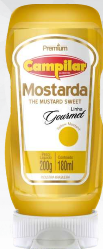
CÓD: 5768 - MOSTARDA PREMIUM 180ml - CX: 12X180ml EAN: 7 896547 901503