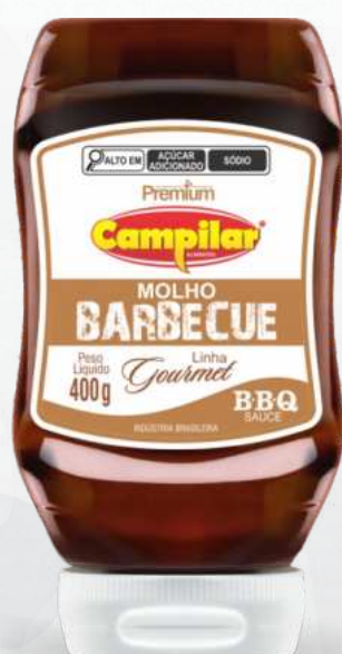
CÓD: 5761 - BARBECUE PREMIUM - 400g - CX: 6X400g EAN: 7 896547 901275