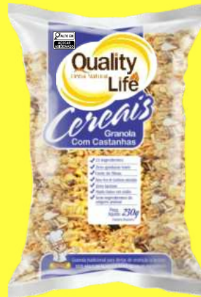
CÓD: 067 - GRANOLA COM CASTANHA - 230g - CX: 10X230g EAN: 7 896547 905877