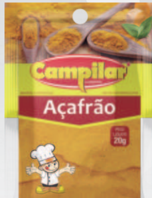
CÓD: 073 - AÇAFRÃO - 20g CX: 30X20g - EAN: 7 896547 900216