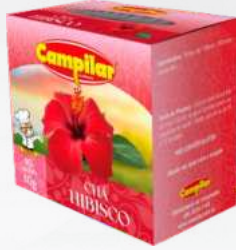
CÓD: 5538 - CHÁ HIBISCO 10g CX: 12X10g - EAN: 7 896547 901350