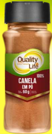
CÓD: 6332 - CANELA EM PÓ 60g CX: 6X60g - EAN: 7 896547 903194