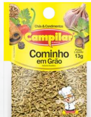
CÓD: 1354 - COMINHO EM GRÃO - 13g CX: 30X13g - EAN: 7 896547 900261