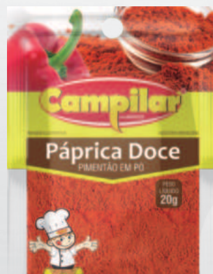
CÓD: 6121 - PÁPRICA DOCE - 20g CX: 30X20g - EAN: 7 896547 902913