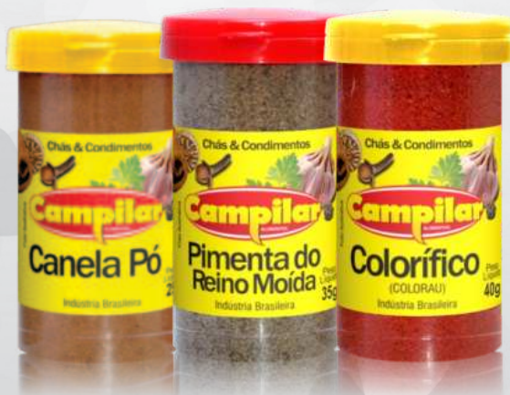
CÓD: 878 - CANELA EM PÓ - POTE - 25g CX: 12X25g - EAN: 7 896547 907598