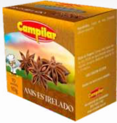
CÓD: 5878 - ANIS ESTRELADO - 10g CX: 12X10g - EAN: 7 896547 906065