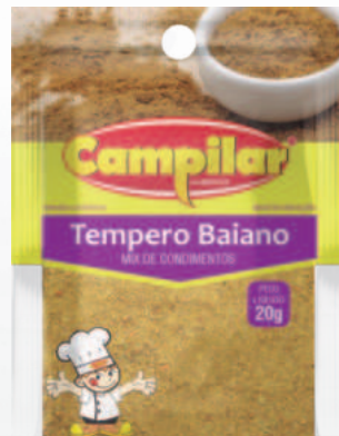
CÓD: 094 - TEMPERO BAIANO - 20g CX: 30X20g - EAN: 7 896547 907109