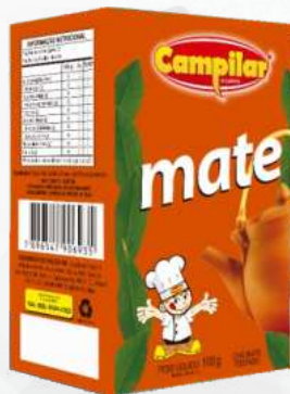
CÓD: 1039 - CHÁ MATE 100g CX: 24X100g - EAN: 7 896547 906935