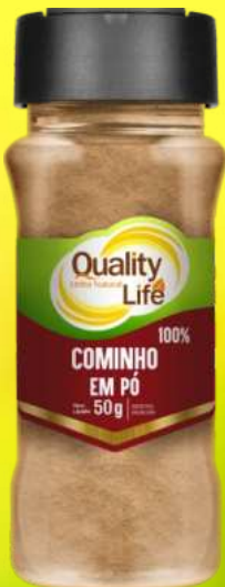
CÓD: 6433 - COMINHO MOÍDO 50g CX: 6X50g - EAN: 7 896547 903279