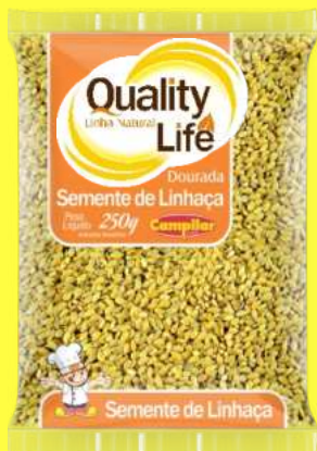
CÓD: 060 - SEMENTE LINHAÇA DOURADA - 250g - CX: 12X250g EAN: 7 896547 905617