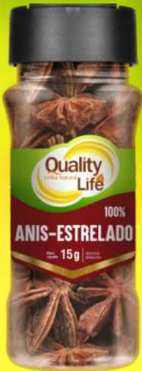
CÓD: 6331 - ANIS-ESTRELADO 15g CX: 6X15g - EAN: 7 896547 903156