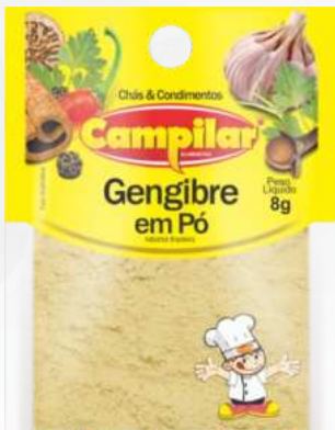
CÓD: 1320 - GENGIBRE EM PÓ - 8g CX: 30X8g - EAN: 7 896547 900247