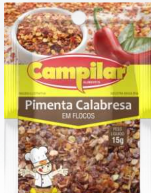
CÓD: 096 - PIMENTA CALABRESA - 15g CX: 30X15g - EAN: 7 896547 907123