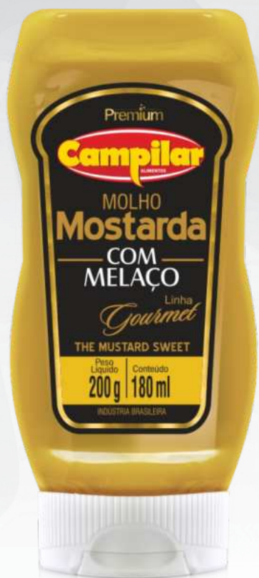
CÓD: 5908 - MOLHO MOSTARDA COM MELAÇO 180ml - CX: 12X180ml EAN: 7 896547 907994