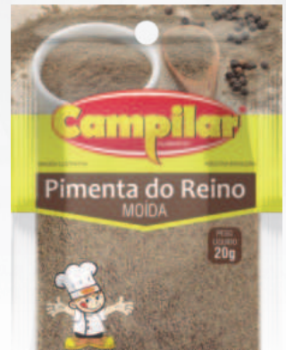
CÓD: 092 - PIMENTA-DO-REINO MOÍDA - 20g CX: 30X20g - EAN: 7 896547 900063