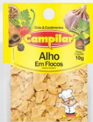
CÓD: 1352 - ALHO EM FLOCOS - 10g CX: 30X10g - EAN: 7 896547 900162