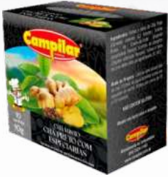
CÓD: 5863 - CHÁ PRETO COM ESPECIARIAS - 10g CX: 12X10g - EAN: 7 896547 901688