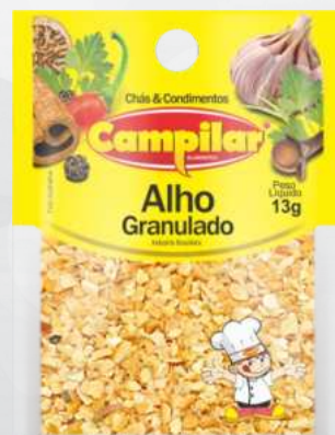
CÓD: 1351 - ALHO GRANULADO - 13g CX: 30X13g - EAN: 7 896547 900254