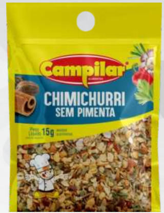
CÓD: 7014 - CHIMICHURRI S/ PIMENTA - 15g CX: 30X15g - EAN: 7 896547 904894