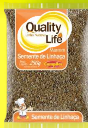
CÓD: 059 - SEMENTE DE LINHAÇA MARROM - 250g - CX: 12X250g EAN: 7 896547 905525