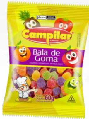
CÓD: 036 - BALAS DE GOMA - 60g CX: 30X60g - EAN: 7 896547 904023