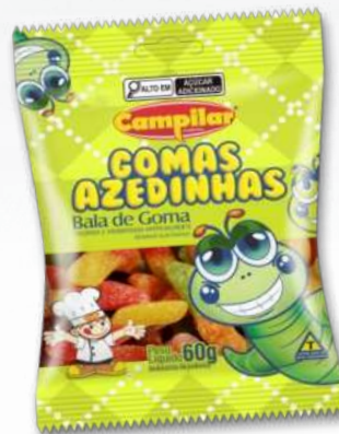
CÓD: 5055 - GOMA AZEDINHAS - 60g CX: 30X60g - EAN: 7 896547 901084