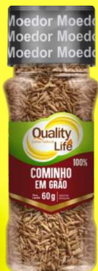
CÓD: 6337 - COMINHO EM GRÃO 60g CX: 6X60g - EAN: 7 896547 903262