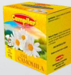
CÓD: 1469 - CHÁ CAMOMILA - 10g CX: 12X10g - EAN: 7 896547 906102