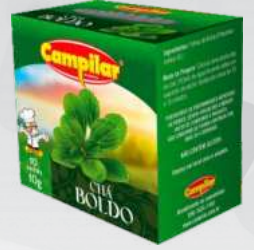
CÓD: 5864 - CHÁ BOLDO - 10g CX: 12X10g - EAN: 7 896547 901633