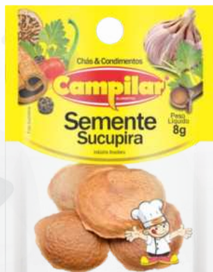
CÓD: 1360 - SEMENTE DE SUCUPIRA - 8g CX: 30X8g - EAN: 7 896547 900186