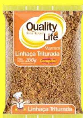
CÓD: 062 - SEMENTE LINHAÇA TRIT. MARROM - 200g - CX: 12X200g EAN: 7 896547 905532