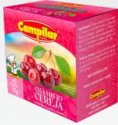
CÓD: 5867 - CHÁ SABOR CEREJA - 15g CX: 12X15g - EAN: 7 896547 901640