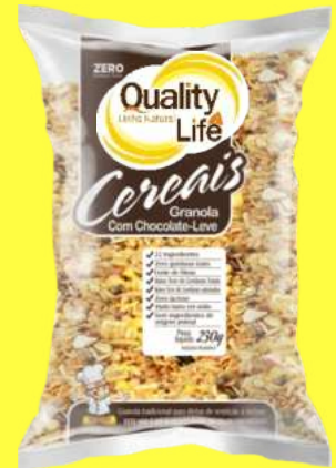
CÓD: 070 - GRANOLA COM CACAU - 230g - CX: 10X230g EAN: 7 896547 905860