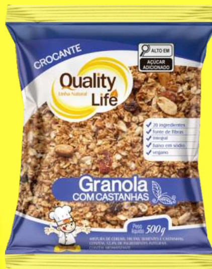
CÓD: 6810 - GRANOLA C/ CASTANHAS CROCANTE - 500g CX: 10X500g - EAN: 7 896547 904405