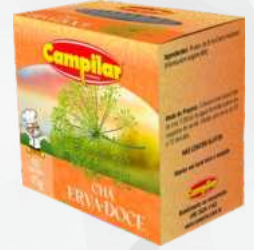
CÓD: 1463 - CHÁ ERVA-DOCE - 10g CX: 12X10g - EAN: 7 896547 906256