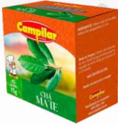
CÓD: 1462 - CHÁ MATE 15g CX: 12X15g - EAN: 7 896547 906409