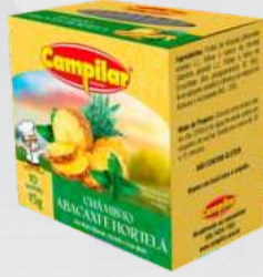
CÓD: 5540 - CHÁ MISTO ABACAXI E HORTELÃ - 15g CX: 12X15g - EAN: 7 896547 901336