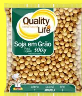
CÓD: 147 - SOJA EM GRÃO 500g - FD: 12X500g EAN: 7 896547 908342