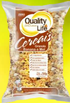
CÓD: 069 - GRANOLA BANANA E MEL - 230g CX: 10X230g EAN: 7 896547 905846