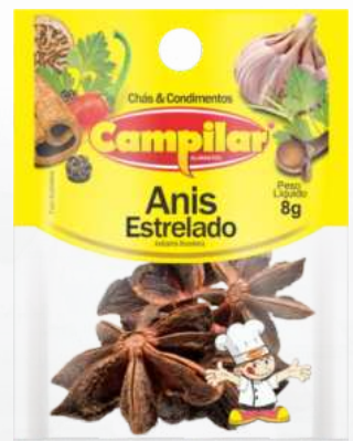
CÓD: 1353 - ANIS ESTRELADO - 8g CX: 30X8g - EAN: 7 896547 900193