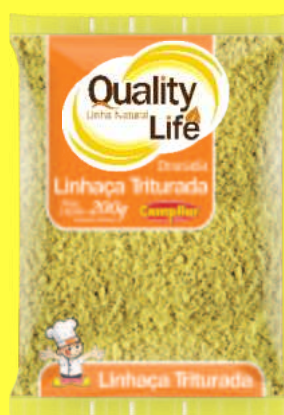
CÓD: 1221 - SEMENTE LINHAÇA TRIT. DOURADA - 200g - CX: 12X200g EAN: 7 896547 907765