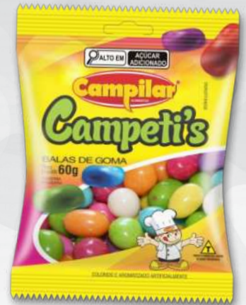
CÓD: 035 - CAMPETI'S - 60g CX: 30X60g - EAN: 7 896547 904047