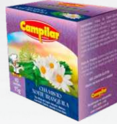
CÓD: 5862 - CHÁ MISTO NOITE TRANQUILA - 10g CX: 12X10g - EAN: 7 896547 901671