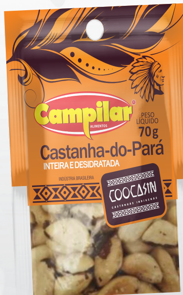
CÓD: 6824 - CASTANHA-DO-PARÁ - 70g CX: 20X70g - EAN: 7 896547 904481