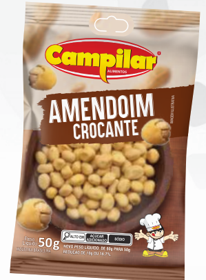
CÓD: 845 - AMENDOIM CROCANTE - 50g CX: 30X50g - EAN: 7 896547 907161