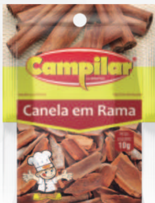
CÓD: 075 - CANELA EM RAMA - 10g CX: 30X10g - EAN: 7 896547 900100