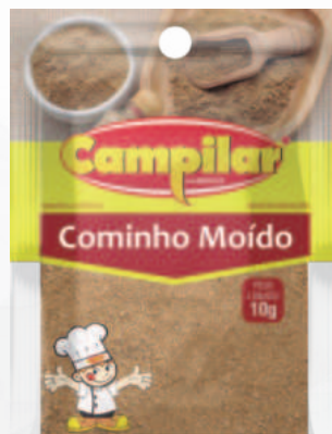
CÓD: 074 - COMINHO MOÍDO - 10g CX: 30X10g - EAN: 7 896547 900179