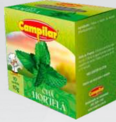
CÓD: 1465 - CHÁ DE HORTELÃ - 10g CX: 12X10g - EAN: 7896547906331