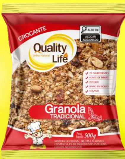
CÓD: 6808 - GRANOLA TRAD. CROCANTE - 500g CX: 10X500g - EAN: 7 896547 904399