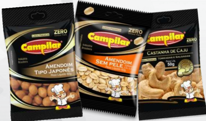
CÓD: 027 - AMENDOIM JAPONÊS - 60g CX: 30X60g - EAN: 7 896547 904016