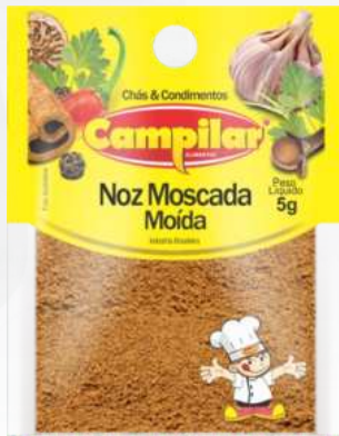
CÓD: 090 - NOZ-MOSCADA MOÍDA - 5g CX: 30X5g - EAN: 7 896547 909721