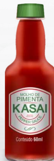
CÓD: 5929 - MOLHO DE PIMENTA KASAI - 60ml - CX: 12X60ml EAN: 7 896547 901954