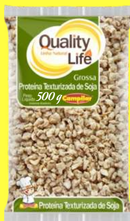
CÓD: 054 - PROTEÍNA DE SOJA 500g - FD: 6X500g EAN: 7 896547 909233