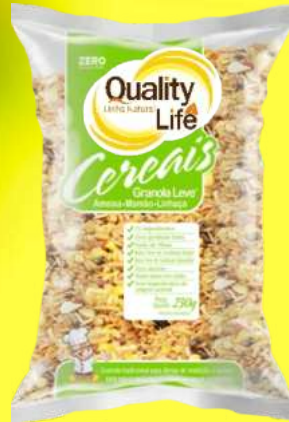
CÓD: 066 - GRANOLA AMEIXA MAMÃO E LINHAÇA - 230g CX: 10X230g - EAN: 7 896547 905884