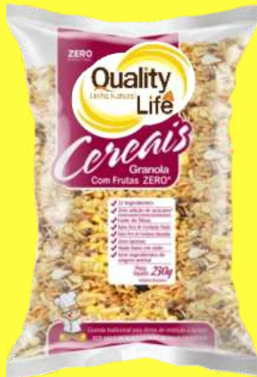
CÓD: 068 - GRANOLA COM FRUTAS - 230g - CX: 10X230g EAN: 7 896547 905839