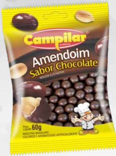
CÓD: 025 - AMENDOIM CHOCOLATE - 60g CX: 30X60g - EAN: 7 896547 904030