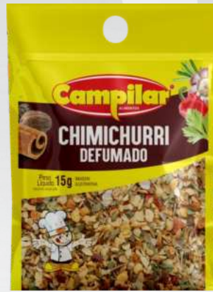
CÓD: 7013 - CHIMICHURRI DEFUMADO - 15g CX: 30X15g - EAN: 7 896547 904870