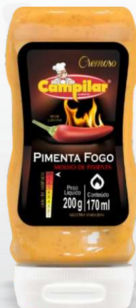
CÓD: 4415 - MOLHO PIMENTA FOGO - 200g - CX: 12X200g EAN: 7 896547 902937