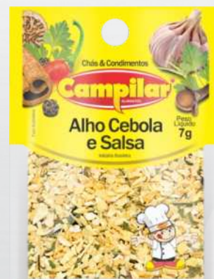
CÓD: 1350 - ALHO CEBOLA E SALSA - 7g CX: 30X7g - EAN: 7 896547 900322