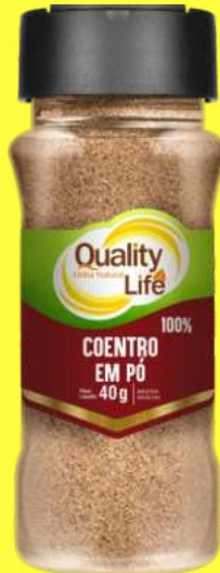
CÓD: 6335 - COENTRO EM PÓ 40g CX: 6X40g - EAN: 7 896547 903248