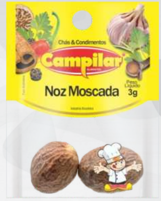
CÓD: 089 - NOZ-MOSCADA - 3g CX: 30X3g - EAN: 7 896547 900049