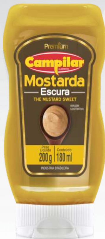
CÓD: 5907 - MOSTARDA ESCURA 180ml - CX: 12X180ml EAN: 7 896547 902005