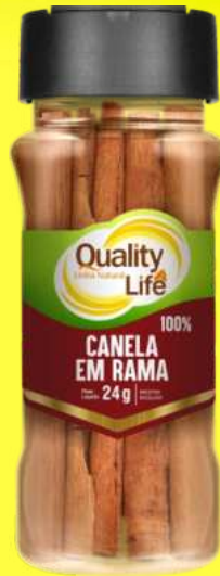
CÓD: 6333 - CANELA EM RAMA 24g CX: 6X24g - EAN: 7 896547 903187