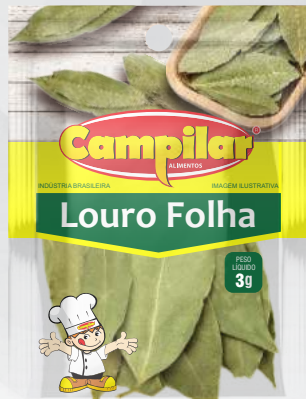
CÓD: 088 - LOURO FOLHAS - 3g CX: 30X3g - EAN: 7 896547 900056