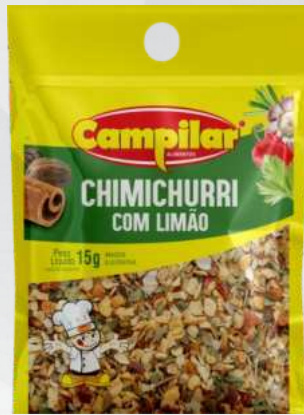
CÓD: 7012 - CHIMICHURRI C/ LIMÃO - 15g CX: 30X15g - EAN: 7 896547 904887