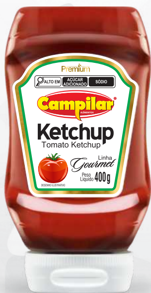
CÓD: 5793 - KETCHUP PREMIUM 400g - CX: 12X400g EAN: 7 896547 901510