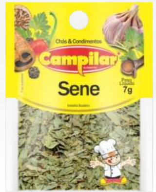
CÓD: 1330 - SENE - 7g CX: 30X7g - EAN: 7 896547 900230