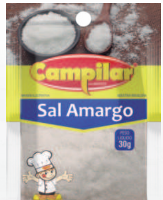
CÓD: 087 - SAL AMARGO - 30g CX: 30X30g - EAN: 7 896547 907154