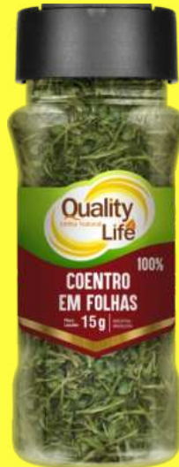
CÓD: 6338 - COENTRO EM FOLHAS 15g CX: 6X15g - EAN: 7 896547 903224