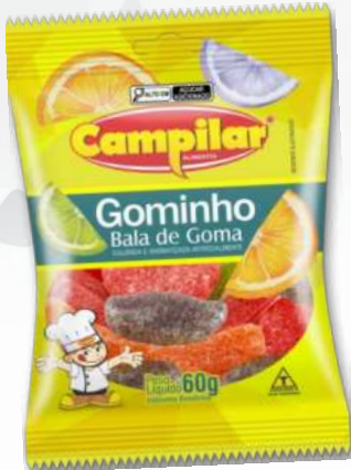
CÓD: 5056 - GOMINHO - 60g CX: 30X60g - EAN: 7 896547 901077