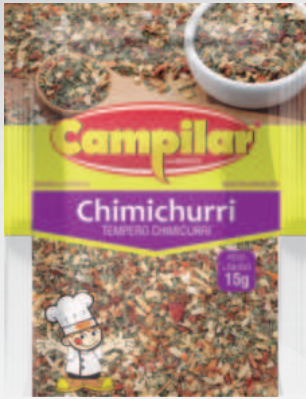
CÓD: 097 - CHIMICHURRI - 15g CX: 30X15g - EAN: 7 896547 907130