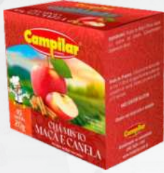
CÓD: 1468 - CHÁ MAÇÃ COM CANELA - 20g CX: 12X20g - EAN: 7 896547 907918