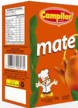
CÓD: 361 - CHÁ MATE 250g CX: 12X250g - EAN: 7 896547 909776