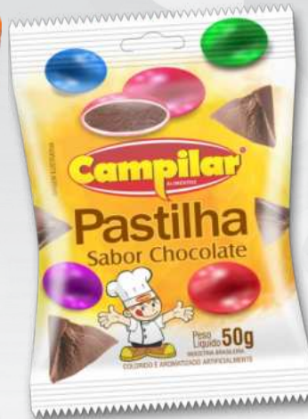
CÓD: 649 - PASTILHAS DE CHOCOLATE - 50g CX: 30X50g - EAN: 7 896547 907178