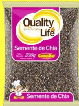
CÓD: 1676 - SEMENTE DE CHIA 200g - FD: 6X200g EAN: 7 896547 900476