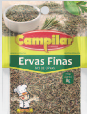
CÓD: 098 - ERVAS FINAS - 8g CX: 30X8g - EAN: 7 896547 907116