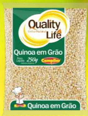
CÓD: 047 - QUINOA EM GRÃO 250g - FD: 6X250g EAN: 7 896547 905723