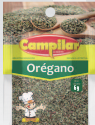
CÓD: 079 - ORÉGANO - 5g CX: 30X5g - EAN: 7 896547 900032