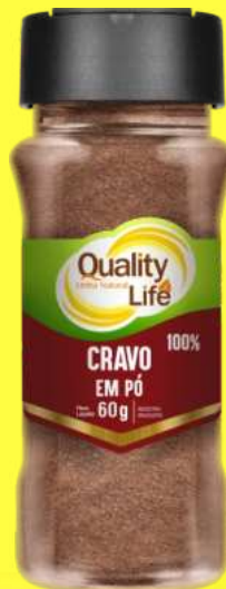
CÓD: 6339 - CRAVO EM PÓ 60g CX: 6X60g - EAN: 7 896547 903286