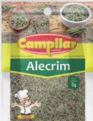
CÓD: 091 - ALECRIM - 5g CX: 30X5g - EAN: 7 896547 907093