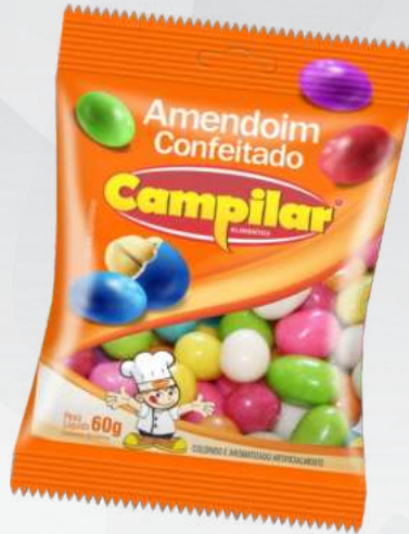
CÓD: 026 - AMENDOIM COLORIDO - 60g CX: 30X60g - EAN: 7 896547 904054