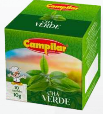
CÓD: 1466 - CHÁ VERDE - 10g CX: 12X10g - EAN: 7 896547 906171