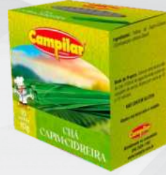
CÓD: 1464 - CHÁ CAPIM-CIDREIRA - 10g CX: 12X10g - EAN: 7 896547 907901