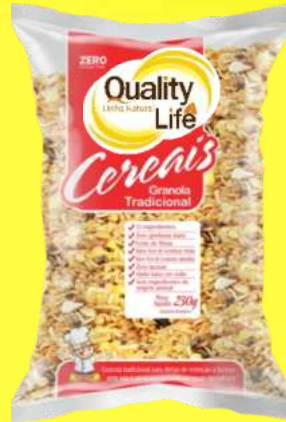
CÓD: 071 - GRANOLA TRADICIONAL 230g - CX: 10X230g EAN: 7 896547 905822