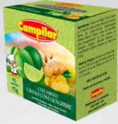
CÓD: 5866 - CHÁ MISTO LIMÃO COM GENGIBRE - 15g CX: 12X15g - EAN: 7 896547 901664