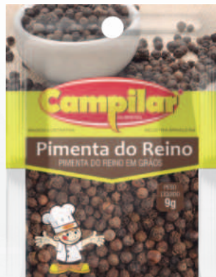
CÓD: 1357 - PIMENTA EM GRÃO - 9g CX: 30X9g - EAN: 7 896547 900070