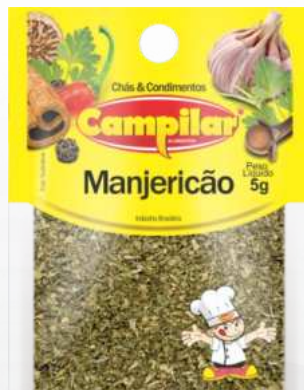
CÓD: 1356 - MANJERICÃO - 5g CX: 30X5g - EAN: 7 896547 900346