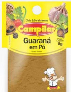
CÓD: 1324 - GUARANÁ EM PÓ - 8g CX: 30X8g - EAN: 7 896547 900285