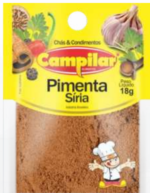
CÓD: 1323 - PIMENTA SÍRIA - 18g CX: 30X18g - EAN: 7 896547 900292