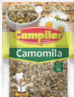
CÓD: 078 - CAMOMILA - 5g CX: 30X5g - EAN: 7 896547 900025