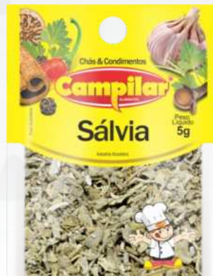
CÓD: 1359 - SÁLVIA - 5g CX: 30X5g - EAN: 7 896547 900308