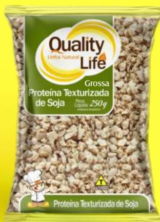
CÓD: 058 - PROTEÍNA DE SOJA 250g - FD: 12X250g EAN: 7 896547 909226