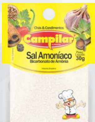
CÓD: 085 - SAL AMONÍACO - 30g CX: 30X30g - EAN: 7 896547 900209