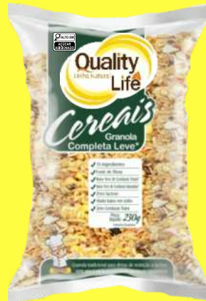
CÓD: 065 - GRANOLA COMPLETA 230g - CX: 10X230g EAN: 7 896547 905853