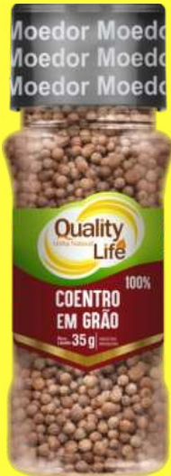
CÓD: 6336 - COENTRO EM GRÃO 35g CX: 6X35g - EAN: 7 896547 903231