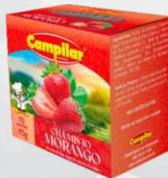
CÓD: 5537 - CHÁ MISTO MORANGO E MAÇÃ - 15g CX: 12X15g - EAN: 7 896547 901367