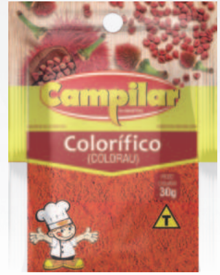
CÓD: 084 - COLORÍFICO - 30g CX: 30X30g - EAN: 7 896547 900124