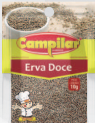
CÓD: 077 - ERVA DOCE - 10g CX: 30X10g - EAN: 7 896547 900087