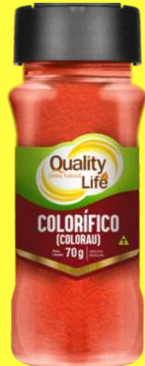
CÓD: 6465 - COLORÍFICO 70g CX: 6X70g - EAN: 7 896547 903255