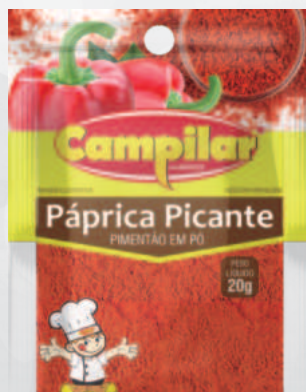
CÓD: 6122 - PÁPRICA PICANTE - 20g CX: 30X20g - EAN: 7 896547 902920