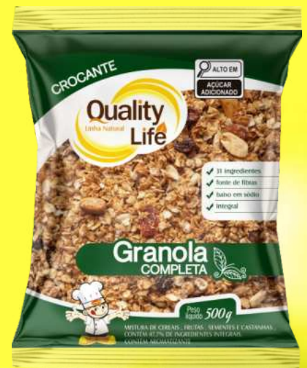
CÓD: 6809 - GRANOLA COMPLETA CROCANTE - 500g CX: 10X500g - EAN: 7 896547 904412