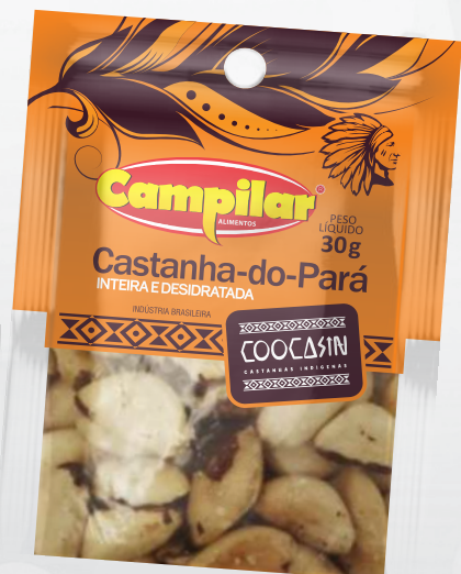
CÓD: 6823 - CASTANHA-DO-PARÁ - 30g CX: 30X30g - EAN: 7 896547 904474