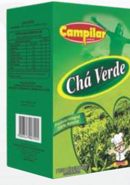
CÓD: 1411 - CHÁ VERDE 80g CX: 12X80g - EAN: 7 896547 907925