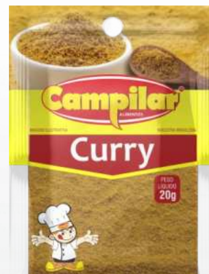
CÓD: 095 - CURRY - 20g CX: 30X20g - EAN: 7 896547 907147