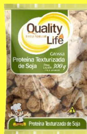
CÓD: 1803 - PROTEÍNA DE SOJA GROSSA 300g - FD: 6X300g EAN: 7 896547 900414