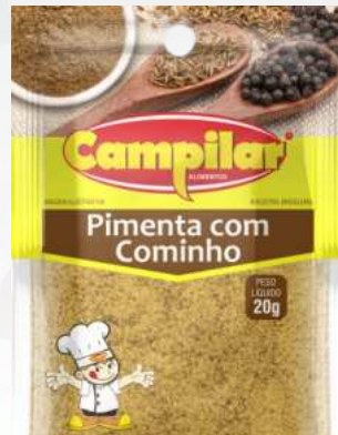
CÓD: 093 - PIMENTA COM COMINHO - 20g CX: 30X20g - EAN: 7 896547 907086