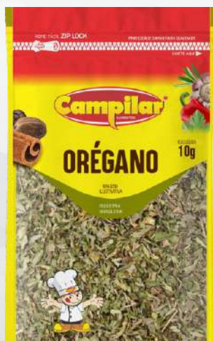
CÓD: 063 - ORÉGANO - 10g CX: 15X10g - EAN: 7 896547 908199