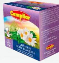
CÓD: 5862 - CHÁ MISTO NOITE TRANQUILA - 10g CX: 12X10g - EAN: 7 896547 901671