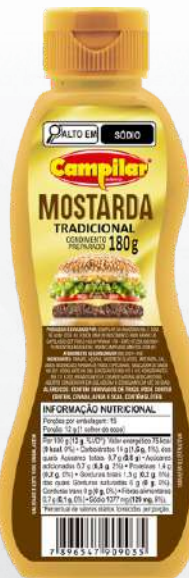
CÓD: 126 - MOSTARDA - 180g CX: 12x180g - EAN: 7 896547 909035