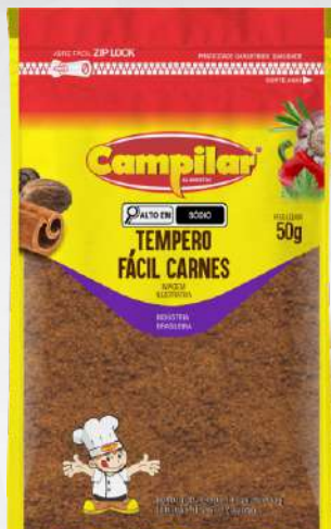
CÓD: 620 - TEMPERO FÁCIL CARNE - 50g CX: 15X50g - EAN: 7 896547 906843