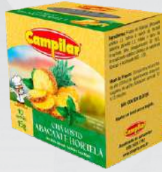
CÓD: 5540 - CHÁ MISTO ABACAXI E HORTELÃ - 15g CX: 12X15g - EAN: 7 896547 901336