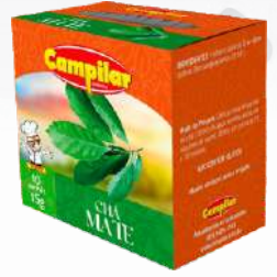
CÓD: 1462 - CHÁ MATE 15g CX: 12X15g - EAN: 7 896547 906409