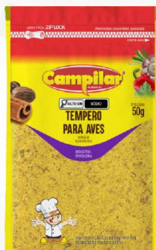
CÓD: 622 - TEMPERO PARA AVES - 50g CX: 15X50g - EAN: 7 896547 906812