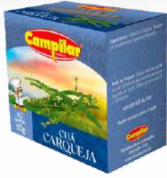
CÓD: 5539 - CHÁ CARQUEJA 10g CX: 12X10g - EAN: 7 898007 901343