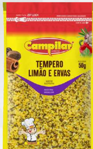
CÓD: 621 - TEMPERO LIMÃO E ERVAS - 50g CX: 15X50g - EAN: 7 896547 906867