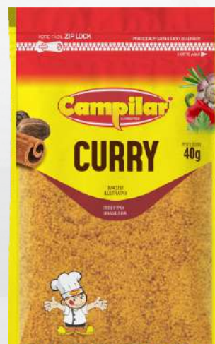
CÓD: 028 - CURRY - 40g CX: 15X40g - EAN: 7896547908137