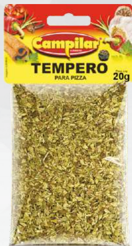
CÓD: 624 - TEMPERO PARA PIZZA - 20g CX: 15X20g - EAN: 7 896547 906850