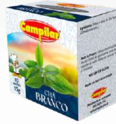
CÓD: 1467 - CHÁ BRANCO 10g CX: 12X10g - EAN: 7 896547 907895