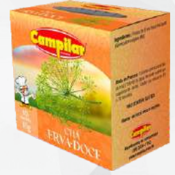
CÓD: 1463 - CHÁ ERVA-DOCE - 10g CX: 12X10g - EAN: 7 896547 906256