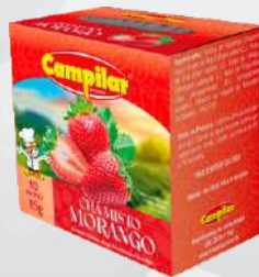
CÓD: 5537 - CHÁ MISTO MORANGO E MAÇÃ - 15g CX: 12X15g - EAN: 7 896547 901367