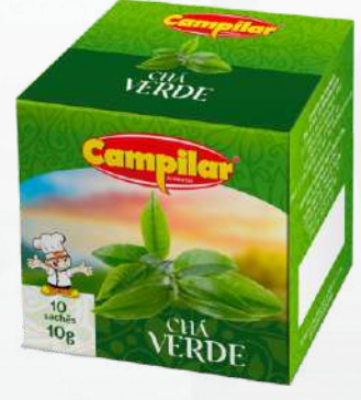
CÓD: 1466 - CHÁ VERDE - 10g CX: 12X10g - EAN: 7 896547 906171