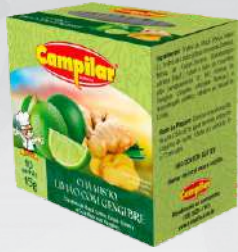
CÓD: 5866 - CHÁ MISTO LIMÃO COM GENGIBRE - 15g CX: 12X15g - EAN: 7 896547 901664