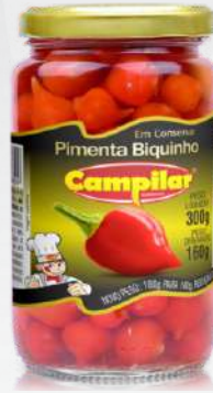
CÓD: 166 - PIMENTA BIQUINHO - 160g CX: 6X160g - EAN: 7 896547 908809