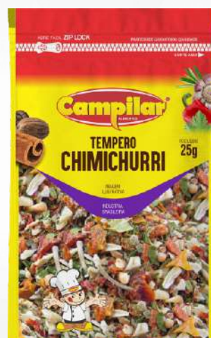
CÓD: 21 - CHIMICHURRI - 25g CX: 15X25g - EAN: 7 896547 908106