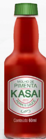
CÓD: 5929 - MOLHO DE PIMENTA KASAI - 60ml - CX: 12X60ml EAN: 7 896547 901954