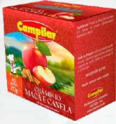
CÓD: 1468 - CHÁ MAÇÃ COM CANELA - 20g CX: 12X20g - EAN: 7 896547 907918