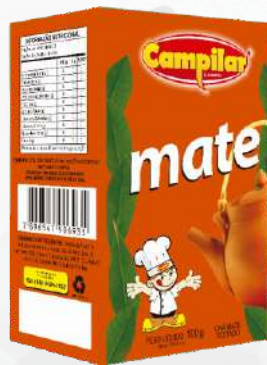
CÓD: 1039 - CHÁ MATE 100g CX: 24X100g - EAN: 7 896547 906935