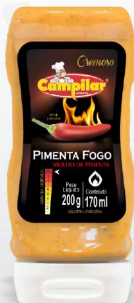
CÓD: 4415 - MOLHO PIMENTA FOGO - 200g - CX: 12X200g EAN: 7 896547 902937