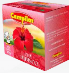
CÓD: 5538 - CHÁ HIBISCO 10g CX: 12X10g - EAN: 7 896547 901350