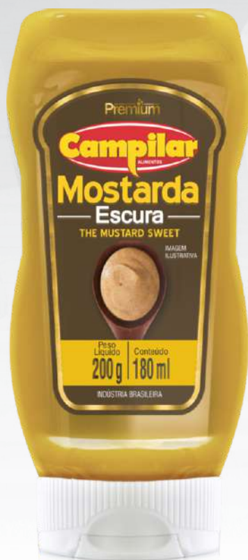
CÓD: 5907 - MOSTARDA ESCURA 180ml - CX: 12X180ml EAN: 7 896547 902005