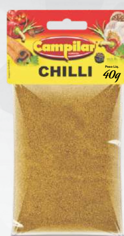
CÓD: 616 - TEMPERO CHILLI - 40g CX: 15X40g - EAN: 7 896547 906775