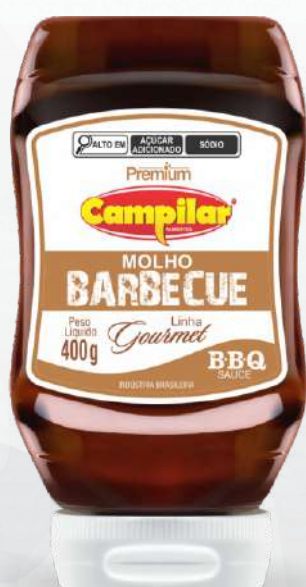
CÓD: 5761 - BARBECUE PREMIUM - 400g - CX: 6X400g EAN: 7 896547 901275