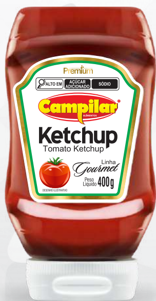
CÓD: 5793 - KETCHUP PREMIUM 400g - CX: 12X400g EAN: 7 896547 901510