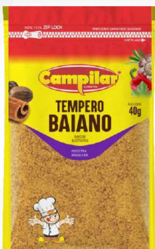
CÓD: 357 - TEMPERO BAIANO - 40g CX: 15X40g - EAN: 7 896547 908519