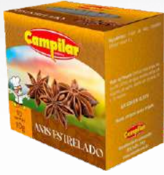
CÓD: 5878 - ANIS ESTRELADO - 10g CX: 12X10g - EAN: 7 896547 906065