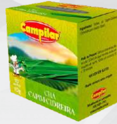
CÓD: 1464 - CHÁ CAPIM-CIDREIRA - 10g CX: 12X10g - EAN: 7 896547 907901