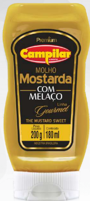
CÓD: 5908 - MOLHO MOSTARDA COM MELAÇO 180ml - CX: 12X180ml EAN: 7 896547 907994