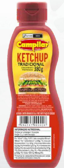
CÓD: 128 - KETCHUP TRADICIONAL - 380g CX: 12X380g - EAN: 7 896547 909028