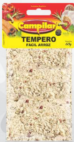
CÓD: 619 - TEMPERO FÁCIL ARROZ - 60g CX: 15X60g - EAN: 7 896547 906836