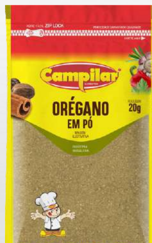
CÓD: 064 - ORÉGANO EM PÓ - 20g CX: 15X20g - EAN: 7 896547 908502