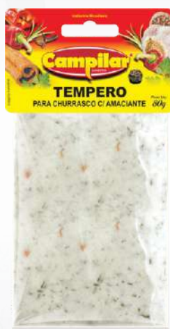
CÓD: 623 - TEMP. P/ CHURRASCO C/ AMACIANTE 80g - CX: 15X80g - EAN: 7 896547 906829