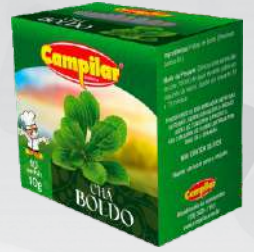
CÓD: 5864 - CHÁ BOLDO - 10g CX: 12X10g - EAN: 7 896547 901633