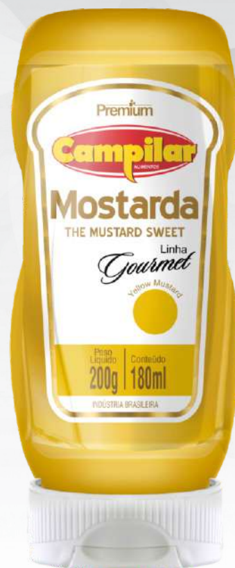
CÓD: 5768 - MOSTARDA PREMIUM 180ml - CX: 12X180ml EAN: 7 896547 901503