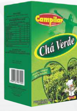
CÓD: 1411 - CHÁ VERDE 80g CX: 12X80g - EAN: 7 896547 907925