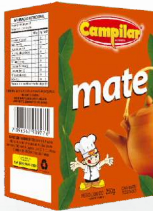
CÓD: 361 - CHÁ MATE 250g CX: 12X250g - EAN: 7 896547 909776