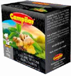
CÓD: 5863 - CHÁ PRETO COM Especiarias - 10g CX: 12X20g - EAN: 7 896547 901688