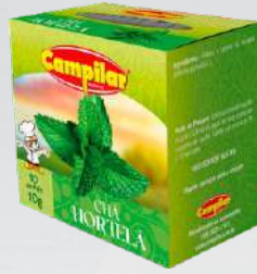
CÓD: 1465 - CHÁ DE HORTELÃ - 10g CX: 12X10g - EAN: 7896547906331