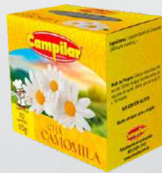
CÓD: 1469 - CHÁ CAMOMILA - 10g CX: 12X10g - EAN: 7 896547 906102